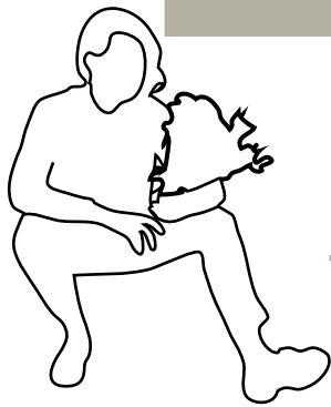
Contours & simplifications